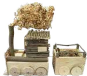
第43回 日本木材青壮年団体連合会会長賞