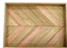
第43回 埼玉県教育長賞

※埼玉県知事賞、埼玉県教育長賞を受賞した作品は、日本木材青壮年団体連合会が主催する「全国児童・生徒木工工作コンクール」に応募出品することができます。